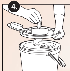
4. Vliestuch durch den Deckel führen; das erste Tuch verwerfen; Deckel immer unmittelbar nach Tuchentnahme wieder verschließen