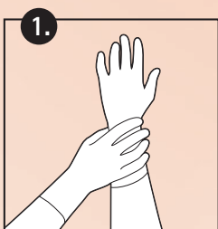
1. Handschuhe tragen