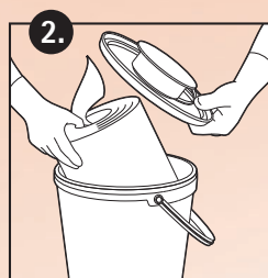
2. Vliestuchrolle einsetzen