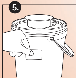
5. Aufkleber beschriften und aufkleben