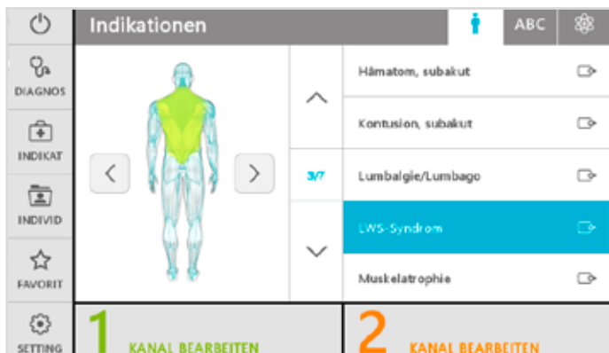
Das umfangreiche Indikationsmenü mit praktischen Filterfunktionen