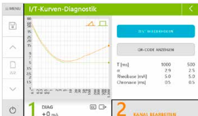
Neben der Standard-I/T-Kurve bietet das Diagnostikmenü auch einen Zeit sparenden Schnelltest