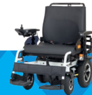
EJOY RD XXL