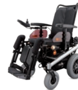
TRIPLEX Der Komfortable 6 km/h Motor: 2 x 450 W