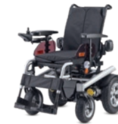
TAIGA Der Leistungsträger 6 km/h Motor: 2 x 600 W