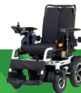
EJOY RD XL