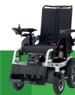
EJOY MD XL