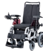
ELTEGO Das Standard Modell 6 km/h Motor: 2 x 250 W