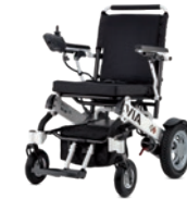
VIA Der Faltbare 6 km/h Motor: 2 x 180 W