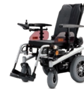
TERRA Der Solide 6 km/h Motor: 2 x 450 W