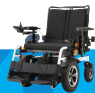
EJOY FD XXL